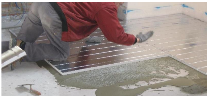
Приклеювання на Adesilex P4